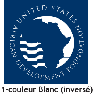
1-couleur Blanc (inversé)