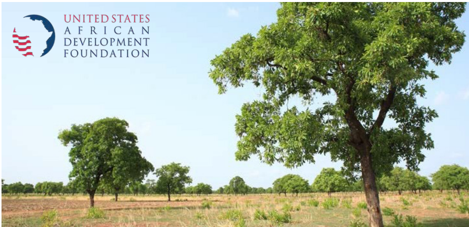
Logo de l'USADF en 4 couleurs sur l'image.

Pour être clairement visible sur une photo, le logo de l'USADF doit être placé dans une zone aux couleurs de fond contrastées.