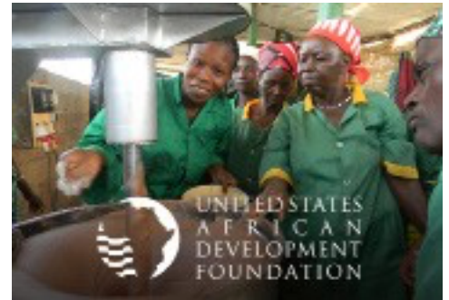
Logo de l'USADF blanc (inversé) sur l'image.

Pour être clairement visible sur une photo, le logo de l'USADF doit être placé dans une zone aux couleurs de fond contrastées.